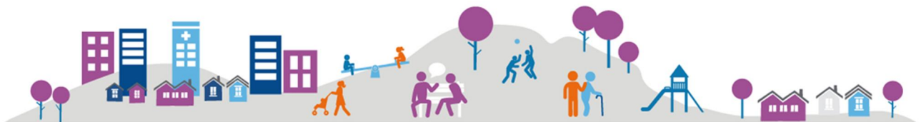
Kuva 2 palvelunohjauksen perusperiaatteet

Mallin tulee tukea suuruuden ekonomian tuomia etuja SEKÄ ketterää kehittämistä. Kilpailuympäristö tulee myös säilyä. Liian pitkä tilaaja/toimittaja ketju johtaa usein kankeaan toimitusmalliin nopeiden käytännön tarpeiden osalta.