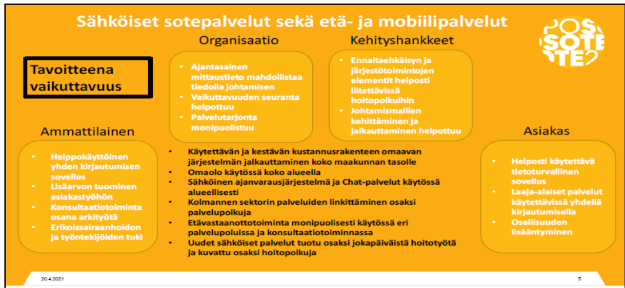
Kuvio 3. Tulevaisuuden Sote-keskus hanke, sähköisten sote-palveluiden sekä etä- ja mobiilipalveluiden selvitystyön yhteenveto

Kotisairaala projektissa on luotu malli Kysterin alueelle kotisairaaloimintaan ja pilotti käynnistyi Kaavilla marraskuussa 2021. Henkilöstöressurssien puute on vaikeuttanut muissa palvelukeskuksissa toiminnan käynnistämistä.