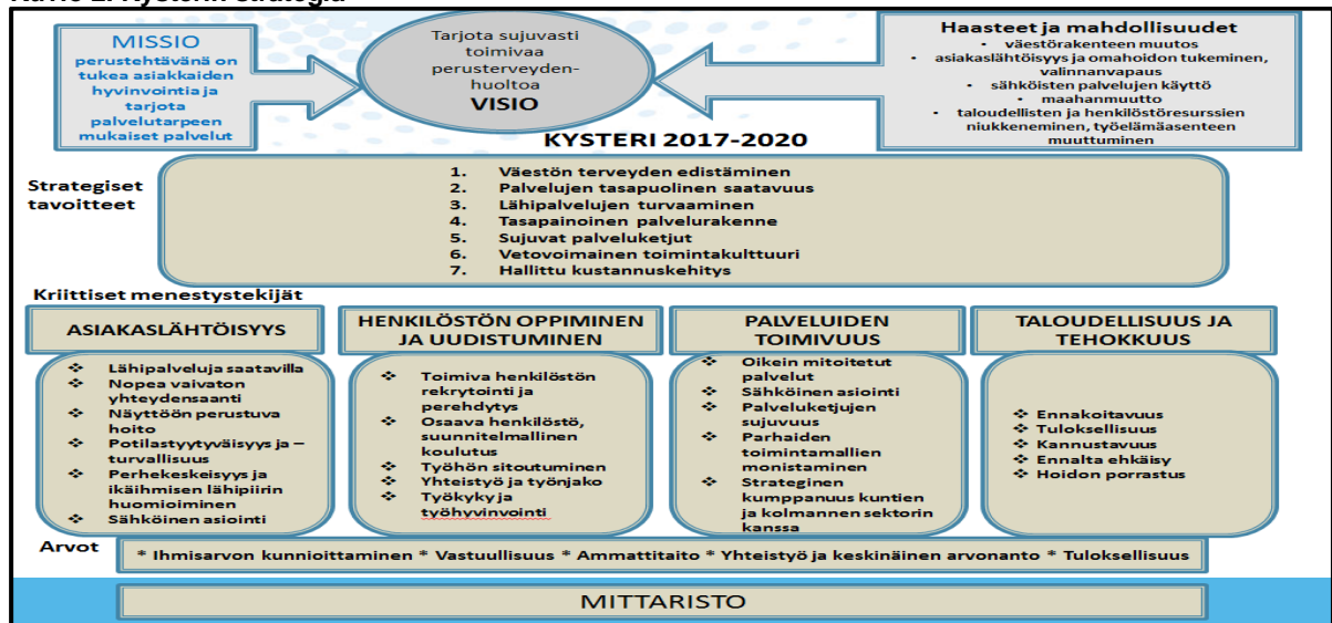
Kuvio 2. Kysterin strategia

Kysterin voimassa oleva strategia on laadittu vuosille 2017-2020 ja johtokunnan päätöksillä (43§ 29.5.2020 ja 47§ 20.9.2021) strategian voimassaoloa jatkettiin vuosille 2021-2022.